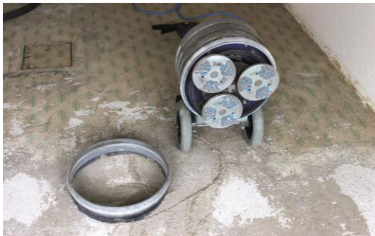
Fraisage du support avec la DSW-400, plurivalente.