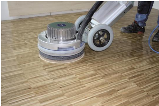
Polissage d'un parquet avec la monodisque DSW-400 et un pad laine.