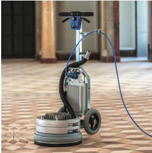
La machine polyvalente pour poseurs de sol et parquet et pour menuisier / charpentier.