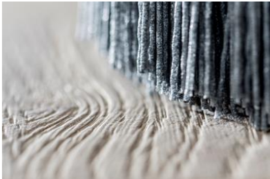
Grâce à la technique de brosseage Derendinger, le parquet retrouve sa structure caractéristique et une finition séduisante.