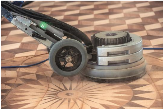
La DSW-400 donne une finition parfaite grâce à sa technique de plateau trio.